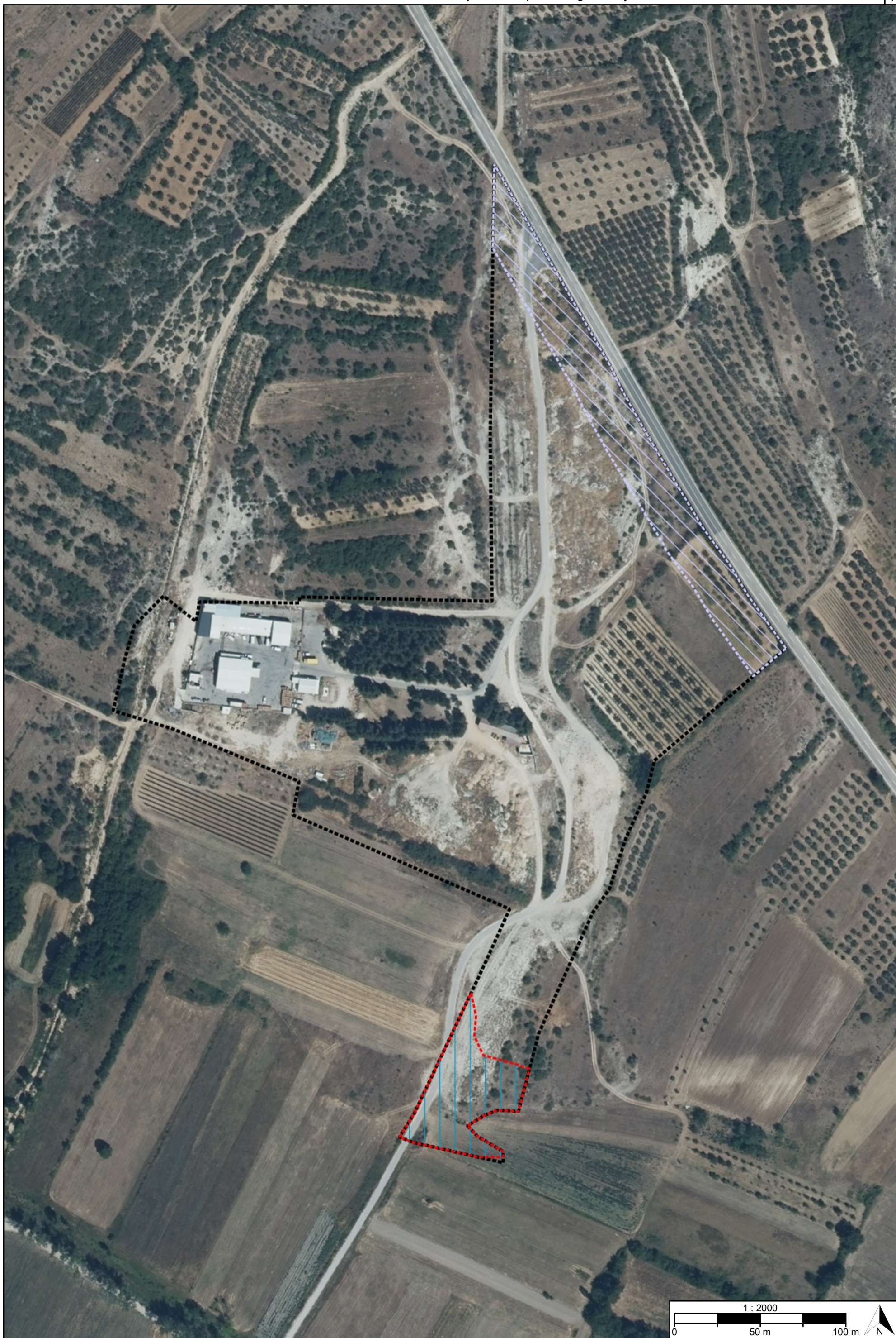
Postupak izrade i donošenja izmjene i dopune prostornog plana Urbanistički plan uređenja proizvodno - poslovne zone Trolokve(IK) ispod Tkalića mosta